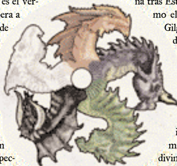
Símbolo de Tiamat