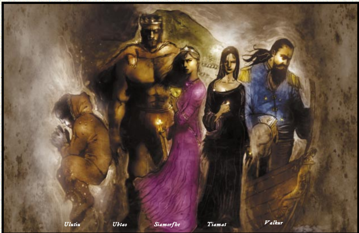
Ilustración de Ben Toplemish

Ilustración de símbolo de Corey Macouret