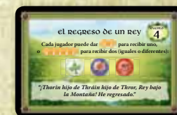
Carta de don

Si la carta de evento revelada es una carta de don, simplemente se siguen las instrucciones de la carta. Las cartas de don dan beneficios inmediatos tales como provisiones, o aumentan la iniciativa, astucia o fuerza.