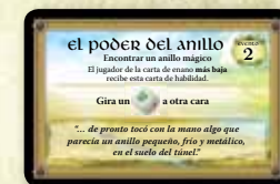
Carta de habilidad

Cada carta de habilidad indica si la carta de enano revelada más alta o más baja recibe la carta de habilidad. Todas las cartas de enano reveladas se descartan al lado de la pila de cartas de enano, y los jugadores recuperan su mano de cartas de enano a 5 cartas.