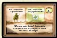
Carta de viaje

IMPORTANTE: Si sólo juegan 2 jugadores, revelan una carta de enano adicional de la pila durante el paso 2, para que el grupo siempre avance tres casillas. Cuando Bilbo avance por el camino debido a esta tercera carta, los efectos de la casilla a la que avanza se ignoran.