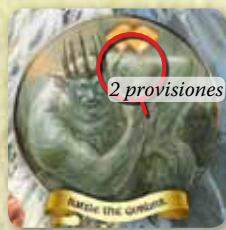
Casilla de aventura

En primer lugar, cada jugador recibe la cantidad de fichas de provisión indicadas en la casilla de aventura. A continuación, el jugador con la iniciativa más alta (es decir, el jugador con el indicador de puntuación verde en su tablero de jugador en la posición más alta) revela la primera carta de aventura y la coloca en la mesa frente a él. En el caso de que varios jugadores empaten en la iniciativa más alta, estos jugadores revelan cada uno una carta de enano de la pila, y la carta de enano revelada más alta gana el empate. Las cartas reveladas se descartan.